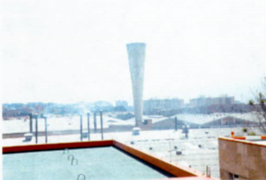
Chimeneas industrias a menos de 100m.