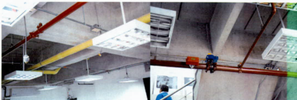
Cables a la vista y ductos sin red de detección contra incendio.

En esta oportunidad motiva hacer uso de la función de advertencia, prevista en el numeral 4º del artículo 5º del Acuerdo 519 de 2012, con el exclusivo propósito que el señor Alcalde Mayor conozca que las obras de la llamada “Sala de Crisis Distrital”, tuvieron una inversión superior a los $11.516 millones; no obstante, transcurridos más de 12 meses de haber sido recibidas a entera satisfacción por parte de la RAM, como responsable de la gerencia e interventoría, ocurre que en criterio de esta Contraloría, con la actividad contractual surtida para el efecto, no se consiguieron los fines estatales perseguidos, en atención a que no presta ningún uso que constituya el beneficio social inicial previsto, que no era otro que centralizar en cabeza del