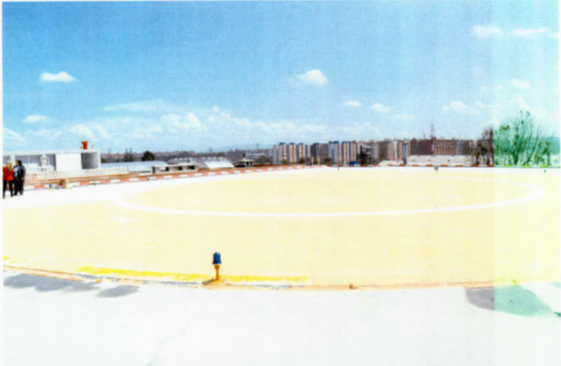
Multifamiliares existentes a menos de 300m del Helipunto.

Lo cierto señor Alcalde es que a la fecha en dicha pista no ha aterrizado la primera aeronave y el Distrito tan solo cuenta con la Resolución 02553 del 5 de junio de 2013, expedida por la UNIDAD ADMINISTRATIVA ESPECIAL DE AERONAUTICA CIVIL “Por la cual se Concede Permiso de Operación al Helipunto del CUERPO OFICIAL DE BOMBEROS” en el Distrito Capital de Bogotá.”