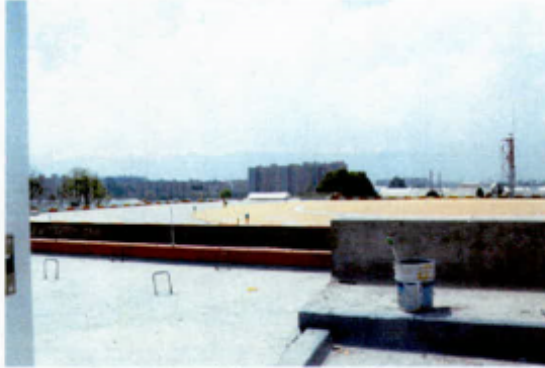
Torre de Telefonía Móvil a menos de 30m