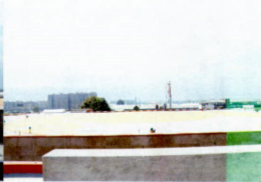
Arboles con copas altas a menos de 30m.