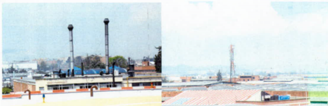
Chimeneas industriales existentes a menos de 100m. del helipunto.

Lo cierto es que el Distrito Capital hizo una inversión por valor superior a los $2.500 millones, para el reforzamiento del edificio, en orden a construir en la terraza del mismo un helipunto, en criterio de esta Contraloría existen serios indicios que ponen en evidencia que técnicamente no es posible el aterrizaje de un helicóptero en dicho punto, habida cuenta que los ángulos de ingreso al lugar tienen grandes obstáculos como árboles, torres de comunicaciones, y lo que es peor aún, está ubicado dentro de un radio de aproximadamente 300 m que colinda con los edificios de vivienda multifamiliar del Sector Salitre, y a menos de 100m de las chimeneas del Sector Industrial, conforme lo ilustra el siguiente registro fotográfico: