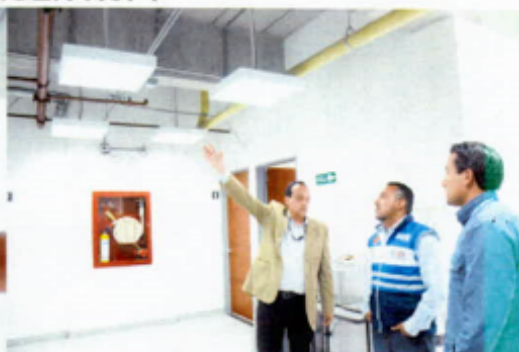
no posee sistema de detección de incendio