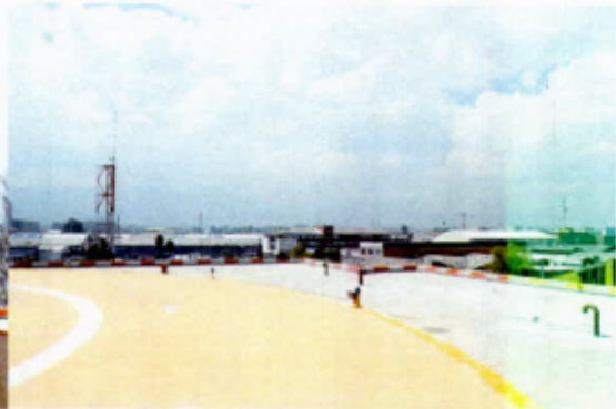
Antenas de Comunicación a menos de 30m.